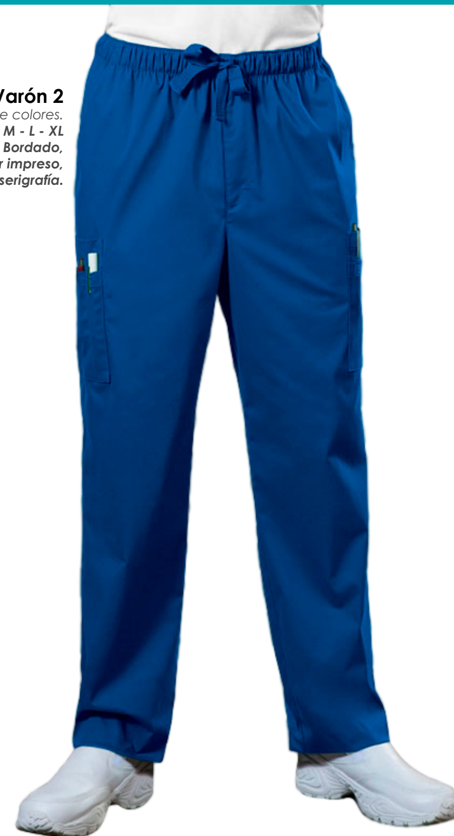
Pantalon Varón 2 Variedad de colores. Tallas: S - M - L - XL Logotipo / nombre: Bordado, Transfer impreso, serigrafía.