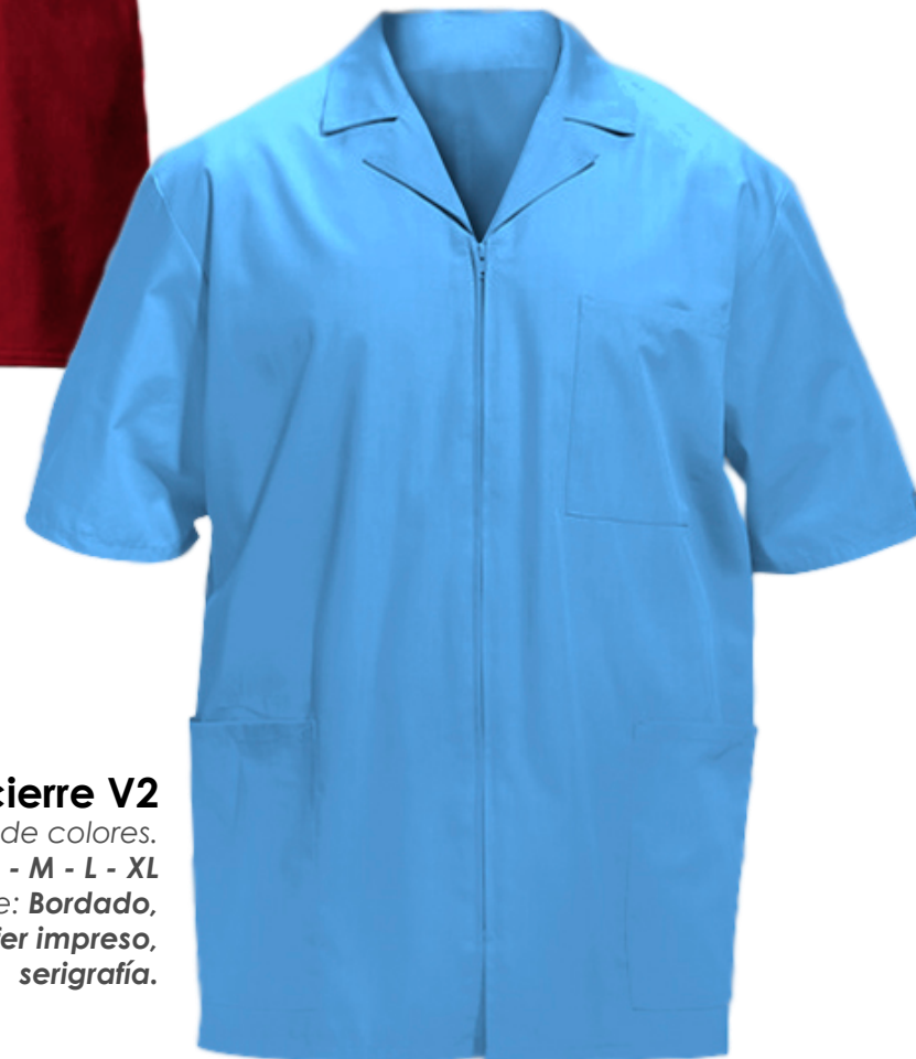
Camisa con cierre V2 Variedad de colores. Tallas: S - M - L - XL Logotipo / nombre: Bordado, Transfer impreso, serigrafía.