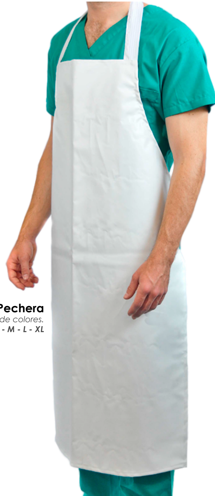
Pechera Variedad de colores. Tallas: S - M - L - XL

contacto: (02) 2 222 8628 · gerencia@papetex.cl · ventas@papetex.cl · www.papetex.cl