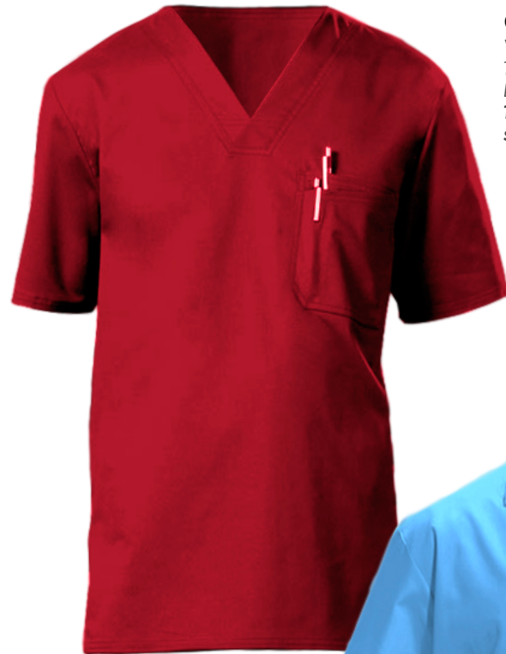
Camisa V1 Variedad de colores. Tallas: S - M - L - XL Logotipo / nombre: Bordado, Transfer impreso, serigrafía.

contacto: (02) 2 222 8628 · gerencia@papetex.cl · ventas@papetex.cl · www.papetex.cl