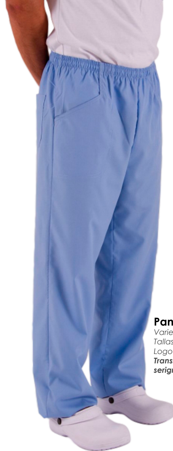
Pantalon Varón 1 Variedad de colores. Tallas: S - M - L - XL Logotipo / nombre: Bordado, Transfer impreso, serigrafía.