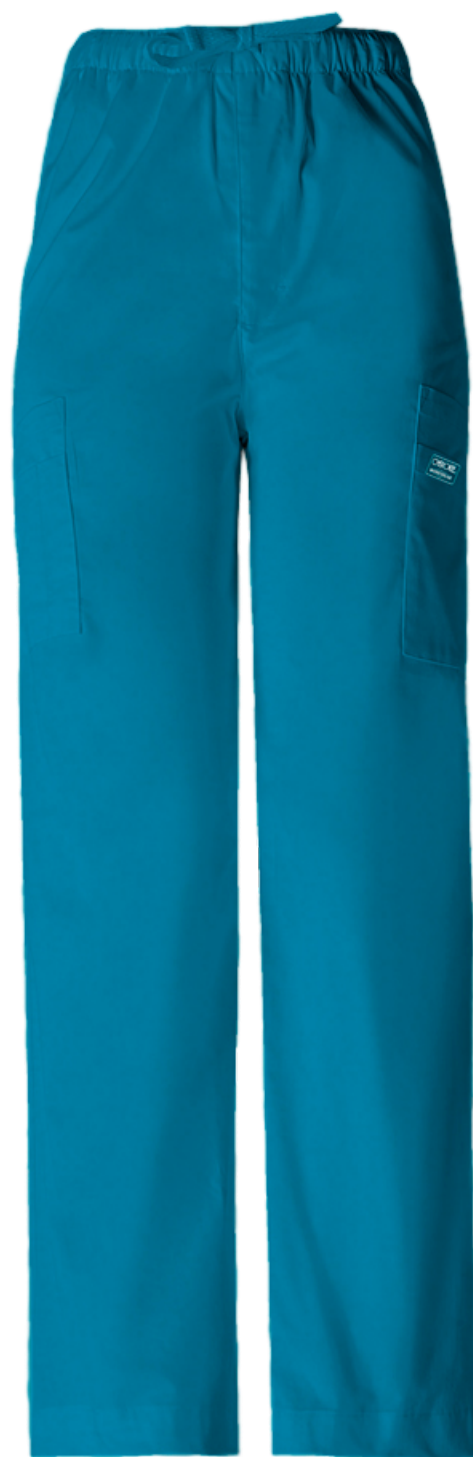
Pantalon Dama Variedad de colores. Tallas: S - M - L - XL Logotipo / nombre: Bordado, Transfer impreso, serigrafía.

contacto: (02) 2 222 8628 · gerencia@papetex.cl · ventas@papetex.cl · www.papetex.cl